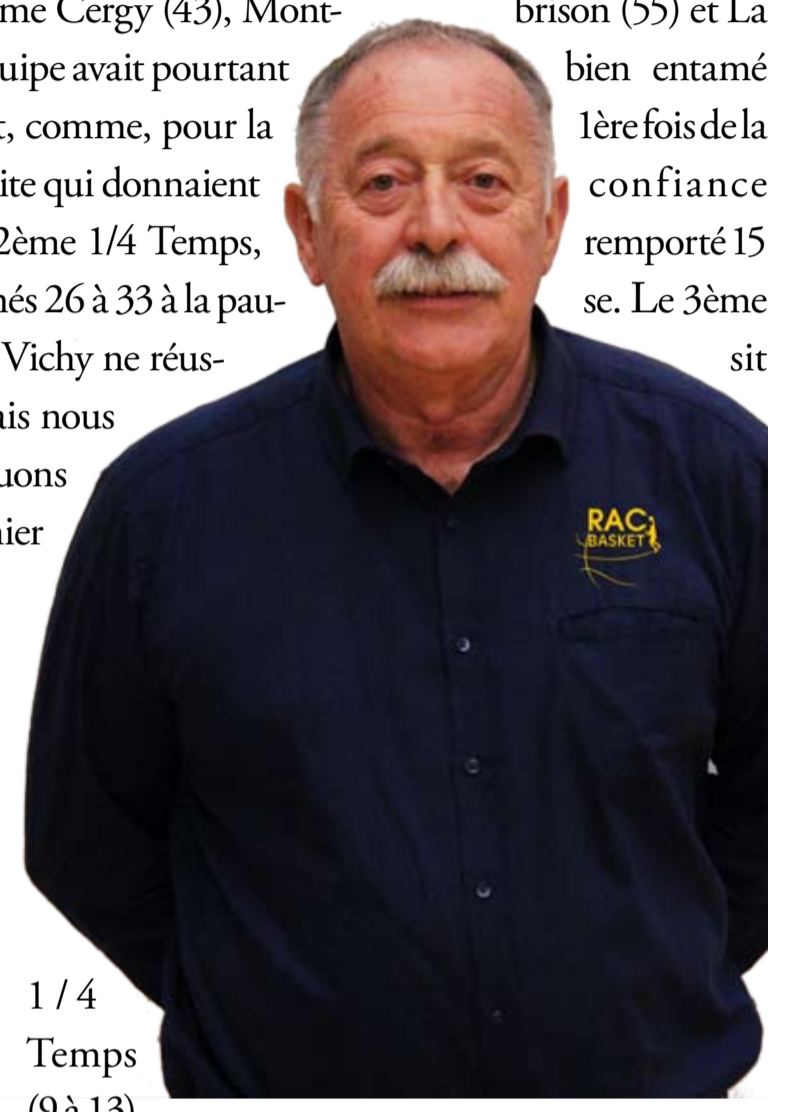
1 / 4 Temps (9 à 13),

3 balles perdues bêtement dans les 2 dernières minutes nous font concéder la plus lourde défaite de la saison (13 Pts d'écart !). Nous concédons notre 4ème défaite de suite, le moral est atteint, il faut se reprendre samedi face à Bordeaux, qui jouait la saison dernière en Pro.B et qui veut y retourner l'an prochain, nos joueurs devront faire le maximum pour remporter une victoire avant la trêve avant de récupérer Vaidotas en janvier. Comme le dit l'expérimenté coach de ST Chamond, après sa défaite samedi à Quimper: « On est déçu par la défaite mais il n'est pas simple de gagner à Monaco, Charleville ou Vichy, face à ces adversaires plus forts, il faut avoir ses joueurs majeurs et faire un minimum d'erreurs donc un excellent match sinon c'est la défaite! ».