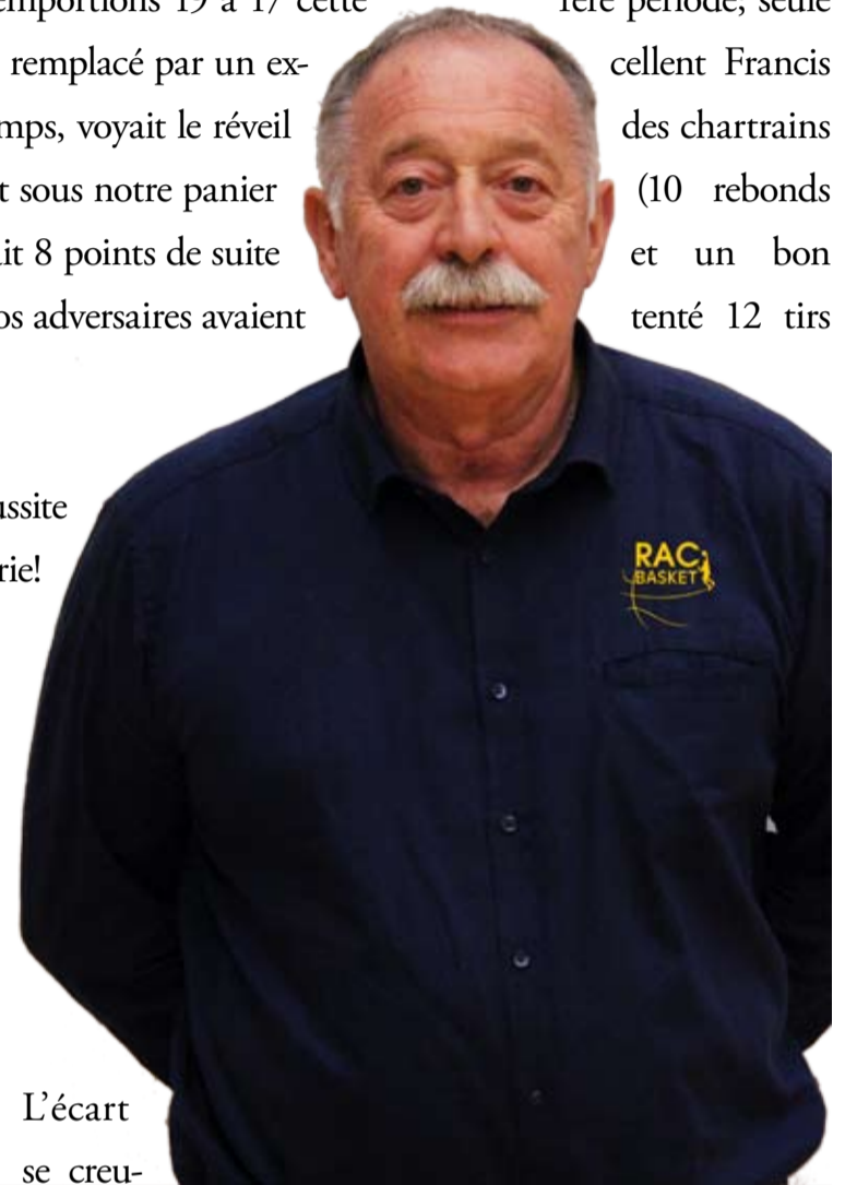
L'écart se creu-

sait: 47 à 60, un grand Vaidotas (10 Pts dans ce 1/4 Temps et un bon passage de Daye nous permettaient de revenir à 57 à 62 mais notre adresse à 3 Pts, était insuffisante (4 sur 16 sur la rencontre !); nous étions menés 64 à 69 au début de la dernière période. Poussé par son public, Chartres ne craquait pas malgré un retour de Rueil à 3 pts; le meneur de Chartres contrôlait le tempo du match et toute la Beauce pouvait exploser, la victoire était acquise. Ce championnat de N1 est passionnant, mis à part le Centre Fédéral (30 défaites !) et Montbrison, 16 équipes jouent encore quelque chose à 6 journées de la fin; nous allons essayer de battre un 2ème demain soir face à Charleville au stadium puis l'autre 2ème, chez lui vendredi soir à Angers; quel programme! Allez les garçons, les play off se méritent mais il faut faire des exploits, chiche ?